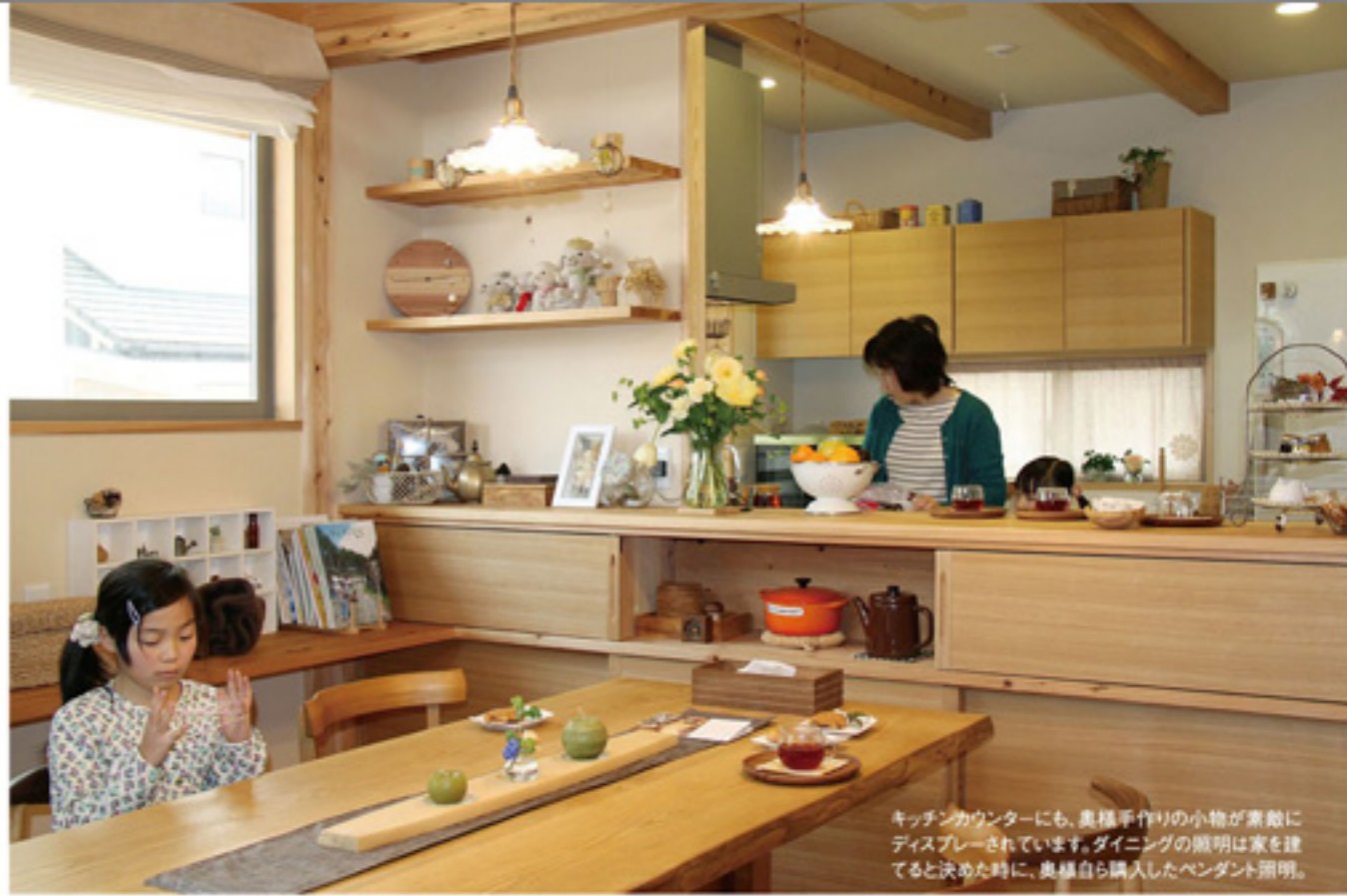
キッチンカウンターにも、奥様手作りの小物が素敵にディスプレイされています。ダイニングの照明は家を建てると決めた時に、奥様自ら購入したペンダント照明。

当社を知ったきっかけは？ ご主人/兄が熊本で、OMソーラーの家を建てたのですが、遊びに行った時、妻が「空気が違う」と言ってます。OMソーラーに興味を持ちました。山口県でOMソーラーの家を建てられる会社を調べた時に、安成工務店の名前を知りました。雑誌「ナチュラル」でも見たと思います。