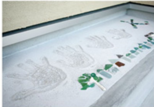
家づくりの思い出に、家族の手形と以前住んでいた近くの海岸で拾ったビーチグラスを使って、子供たちが家の形に、前に住んでいた場所の思い出も今の家に残しましたと奥様。