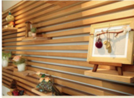
奥様手作りの小物をディスプレイ。棚は自由に取外したり、位置を変えたりとディスプレイを楽しまれています。家の計画の中で思い入れのあるICの中野さんが奥様のイメージをスケッチしてくれているので、ここにこんなものを飾ろう！という気持ちになりましたと奥様。