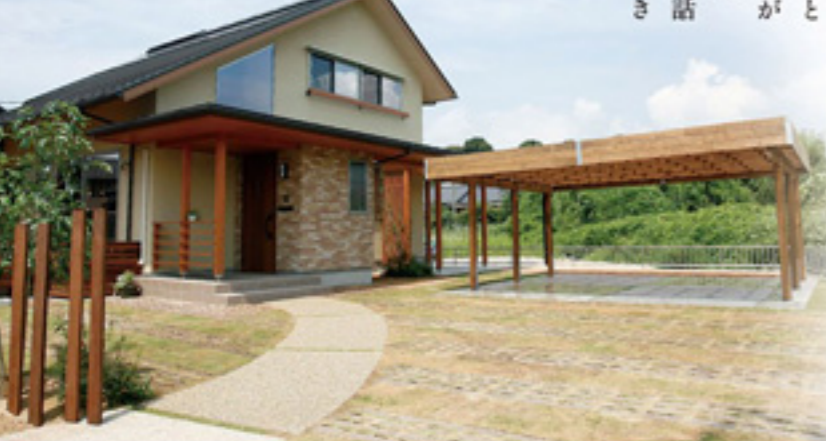
宇部支店 店長 池田 聖 とても人柄のよいK様は、とても人柄のよいOB様の紹介でした。縁が縁を呼び安成の輪が広がります！お引渡ししてから3度目の訪問。とてもかわいく飾りつけされていて、安成の家がよりいかに！いつもかわいいお皿に可愛いお菓子を可愛く用意して頂きカフェに来る感じが居心地がよく長居しています。今回の取材でふだん聞けない喜びの言葉も頂き、思わず涙がそうに…。K様また寄らせてもらいますねー！