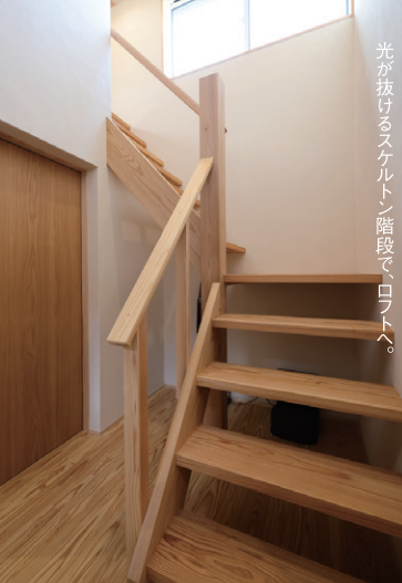
光が抜けるスバルトン階段で、ロフトへ。