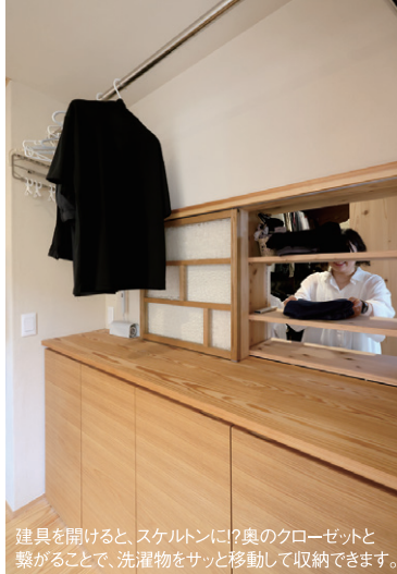
建具を開けると、スケルトンにロフト奥のクローゼットと繋がることで、洗濯物をサッと移動して収納できます。