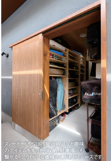
スノーボードやSUP、登山用品など趣味のアイテムをすっきり収納。駐車場にも繋がる、アウトドアな奥様のこだわりスペースです。