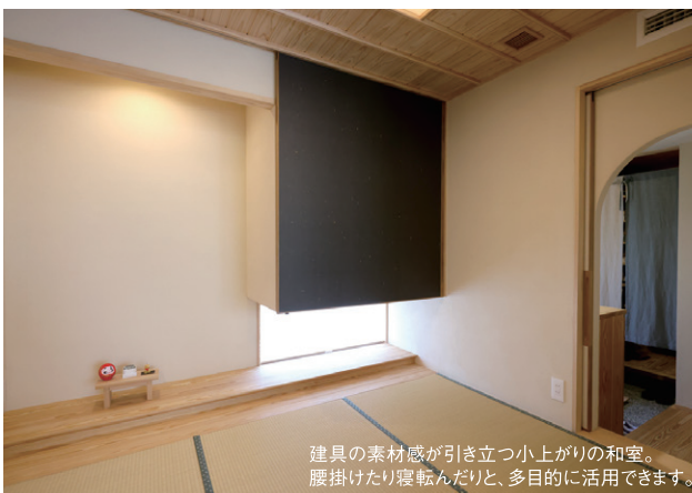
建具の素材感が引き立つ小上がりの和室。腰掛けたり寝転んだり、多目的に活用できます。