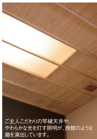
ご主人こだわりの竿縁天井や、やわらかな光を灯す照明が、旅館のような趣を演出しています。

幹線道路沿いの立地ながら静かで穏やかなK様邸。建物の配置計画により中庭へと開いた心地よい住まいとなりました。スノーボードやスキューバダイビングなど外での趣味も楽しまれ、暮らしと遊びの両方を満喫されています。楽しい打合せの時間を共有できたことにも、心より感謝申し上げます！