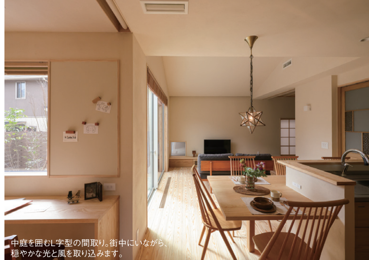
中庭を囲むL字型の間取り。街中にいながら、穏やかな光と風を取り込みます。