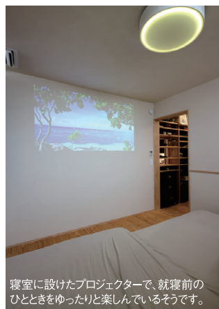
寝室に設けたプロジェクターで、就寝前のひとときをゆったりと楽しんでいます。