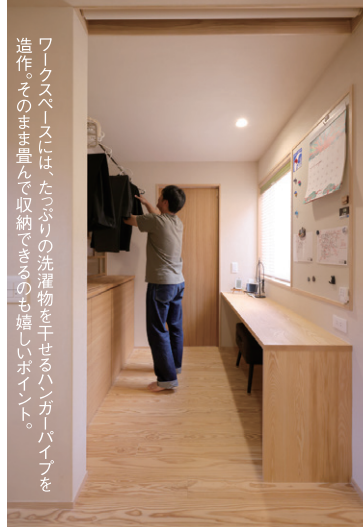
ワークスペースには、たっぷりの洗濯物を干せるハンガーパイプを造作。そのまま畳んで収納できるのも嬉しいポイント。