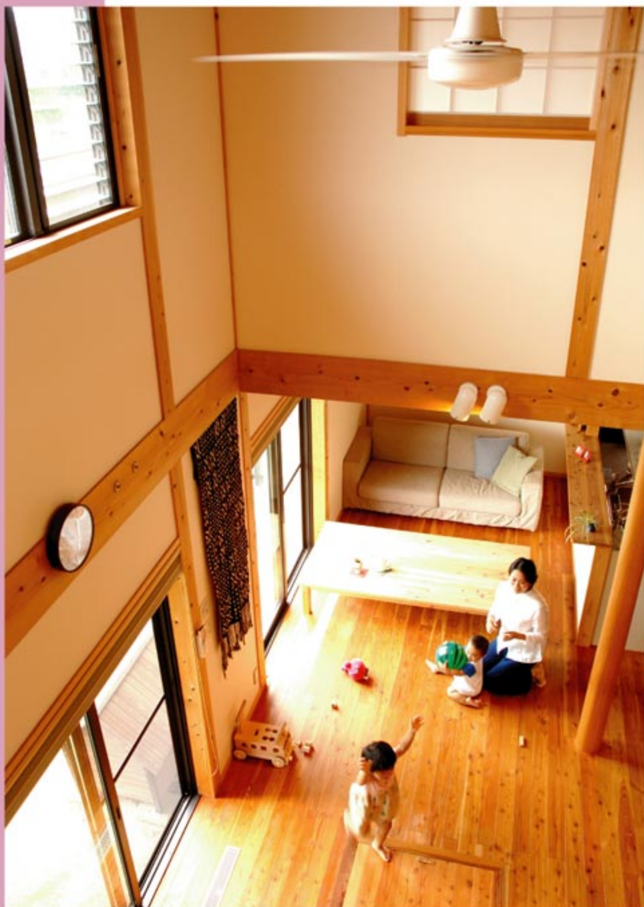
安成さんの木の魅力に圧倒されました。

「OM効果は素晴らしいですよ。特に寒い季節は、家の隅々から更に床まで暖かく心地よいです。よそのお家にいるとその差は歴然で、早く家に帰りたくなっっちゃいます。(笑)」 「玄関を黒く塗ってほしいという希望について、大工さんと現場監督さんが塗る塗らないで白熱論争になったことがありました。私のことそつちのけで(笑)。真剣に取り組んでいただいていたことがいろいろな場面で感じられました。」 そして、お子様にもうれしい変化が。「新しい家では長女の夜鳴きがほぼ無くなり、お風呂も嫌がらなくなりました。お除で私たちがもぐつすり、有難いです。」 夢をカタチにする私たちの仕事。これからも誇りを持って取り組んで参ります。