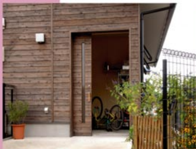
バイクを愛するご夫妻の愛車用車庫。ご近所迷惑を考慮して扉はシャッターではなく引き戸を選択されました。