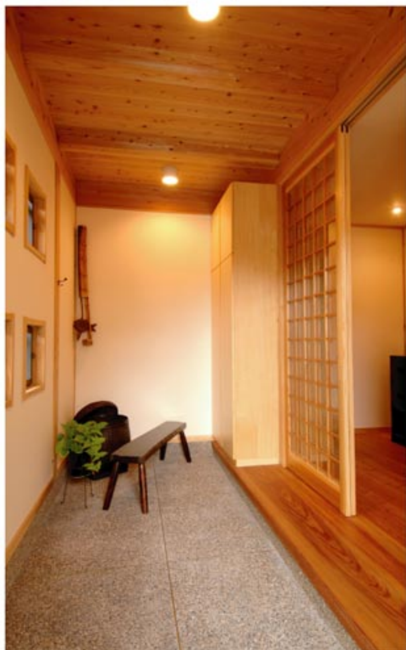
木が堂々としていて家の隅々まで温かっさりしています。