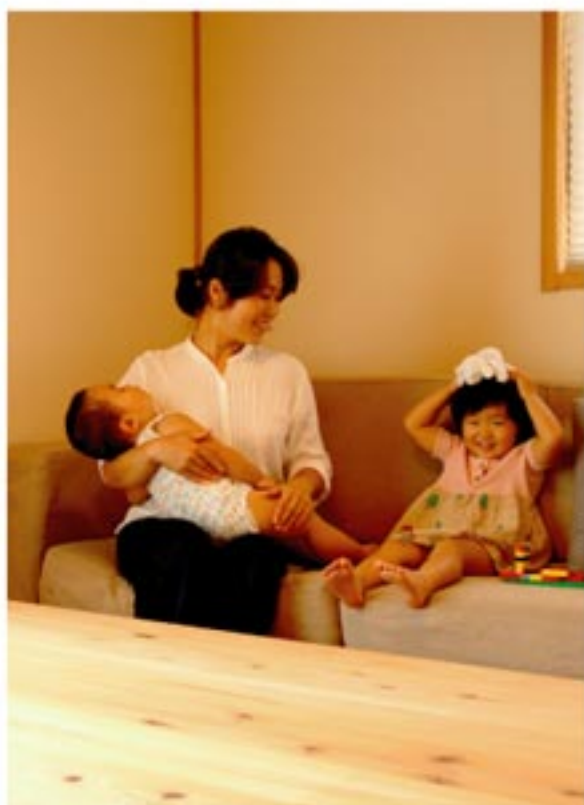
木のお家は気持ちいいなあ。